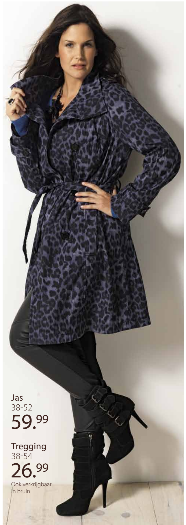
Jas 38-52 59.99

Hét materiaal van dit seizoen. Draag het als jasje, gilet, jurk of tregging, stoer of sexy. In combinatie met kleur of print voor dé juiste fashion look!