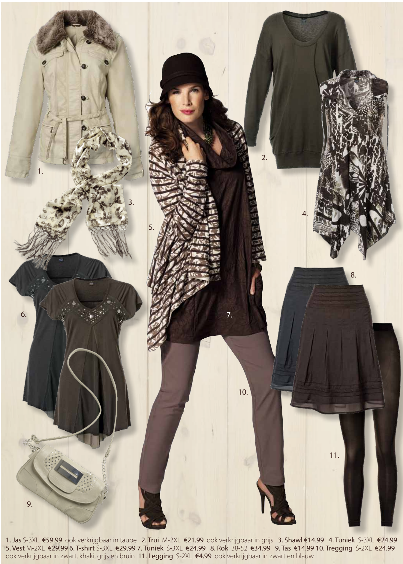
1. Jas S-3XL €59.99 ook verkrijgbaar in taupe 2. Trui M-2XL €21.99 ook verkrijgbaar in grijs 3. Shawl €14.99 4. Tuniek S-3XL €24.99 5. Vest M-2XL €29.99 6. T-shirt S-3XL €29.99 7. Tuniek S-3XL €24.99 8. Rok 38-52 €34.99 9. Tas €14.99 10. Tregging S-2XL €24.99 ook verkrijgbaar in zwart, khaki, grijs en bruin 11. Legging S-2XL €4.99 ook verkrijgbaar in zwart en blauw