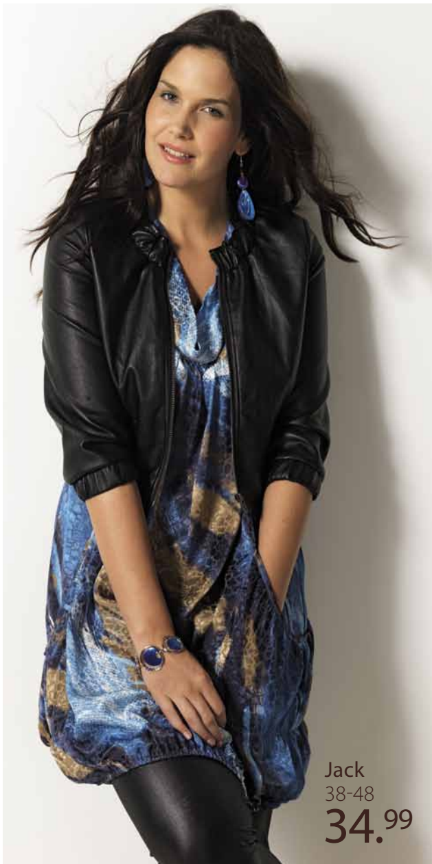
Jack 38-48 34.99